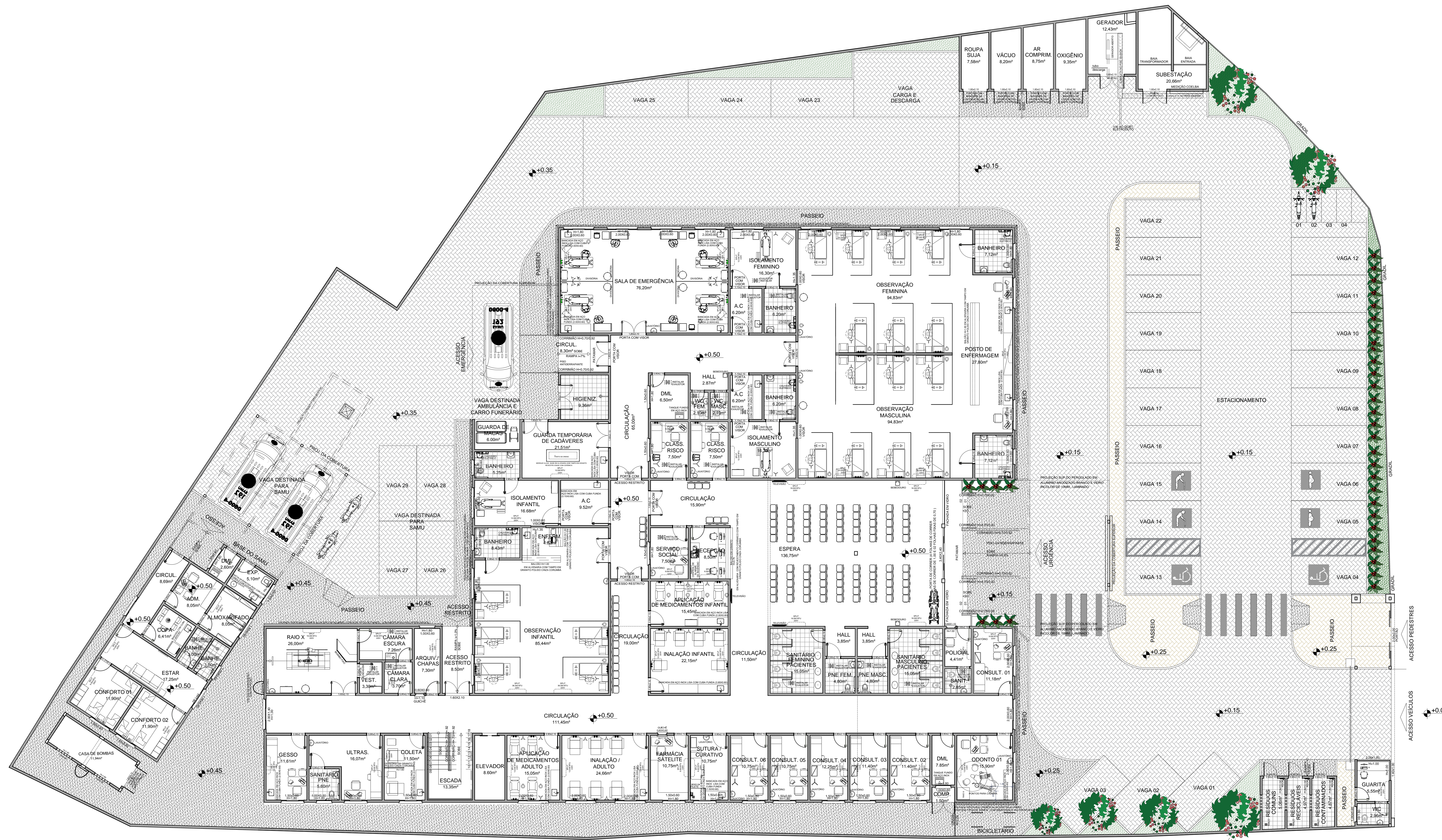
PLANTA DE LAYOUT - TÉRREO ESCALA: 1/100