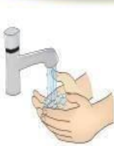
Higienização das mãos

Devem ser seguidas para TODOS OS PACIENTES , independente da suspeita ou não de infecções.