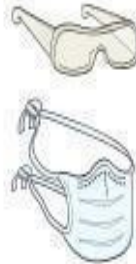
Óculos e Máscara