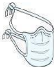
Máscara Cirúrgica (paciente durante o transporte)