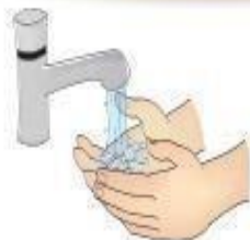
Higienização das mãos