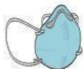
Máscara PFF2 (N-95) (profissional)