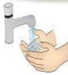
Higienização das mãos