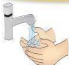
Higienização das mãos