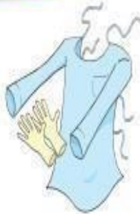
Luvas e Avental