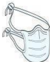
Máscara Cirúrgica (paciente durante o transporte)