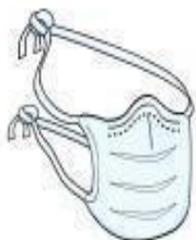
Máscara Cirúrgica (profissional)